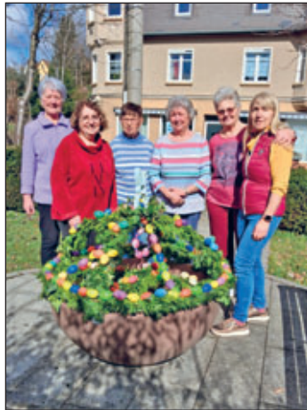
Unser Osterbrunnen vor dem „Grüßer“