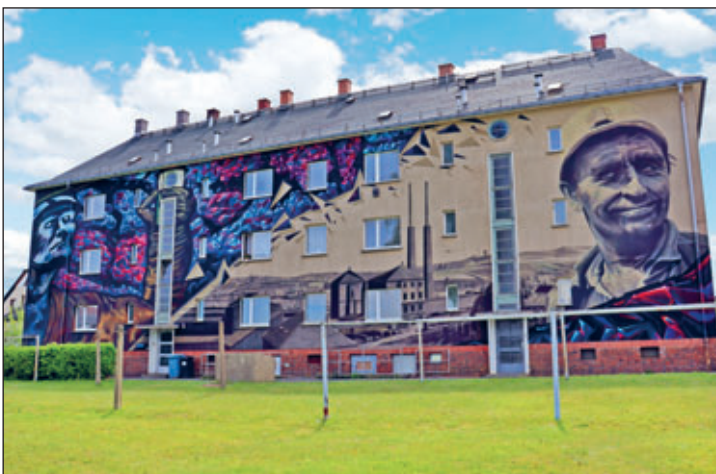
Graffitiprojekt „De Cord“

Unser besonderer Dank gilt allen Beteiligten, Unterstützerinnen und Unterstützern sowie den zahlreichen engagierten Mitwirkenden, die zum Gelingen des Projektes beigetragen haben.