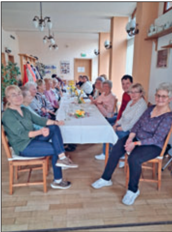
Ein gemütlicher Nachmittag zum Frauentag

(Montag bis Mittwoch: 09:00 bis 14:00 Uhr unter Telefon: 037298 12751)