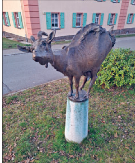
Bergmanns-Kuh am Lindenhof

Die Geldmittel mit einem Gesamtvolumen von knapp 125.000 Euro, bestehend aus Mitteln des Bundes, des Landes, der Stadt Oelsnitz/Erzgeb. sowie der Stiftung – lebendige Stadt Oelsnitz im Erzgebirge, konnten zu-