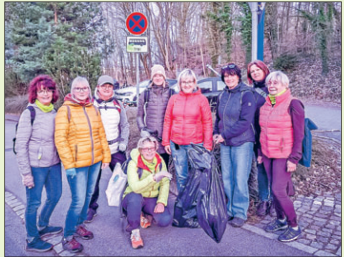
Oelsnitzer Knappen e. V. – SG Frauenfitness