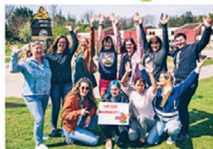
Wir sind nominiert