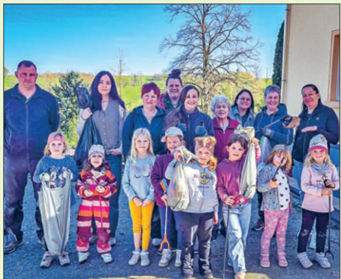
Tanzmäuse des OOCV

Fotorechte entsprechen den Bildunterschriften