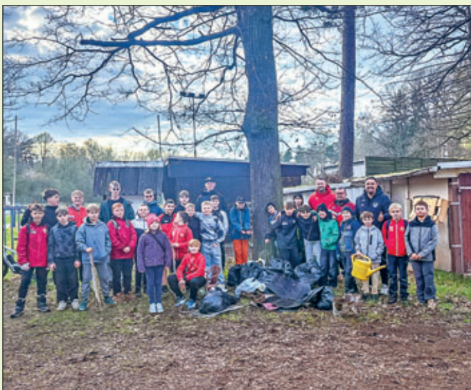
SV Rot-Weiß Neuwürschnitz