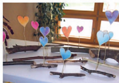
Herzen zum Muttertag