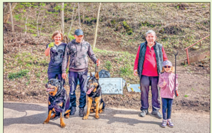
Mitglieder des Schäferhundevereins OG Oelsnitz/Erzgeb.